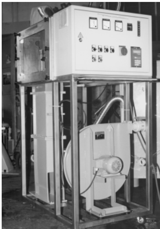
Mobile PLASMACAT Versuchsanlage

Schadstoff- und konzentrationsabhängig. Wir rechnen mit einem Energieverbrauch für die Anregung von 0.5 bis 3 Wh pro m 3 behandelte Luft. Dazu muss noch der Energieverbrauch des Ventilators gezählt werden.