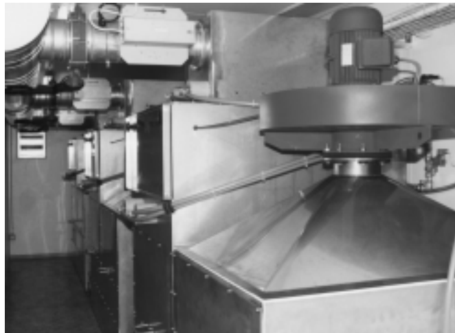
PLASMACAT Einheiten mit integriertem Ventilator