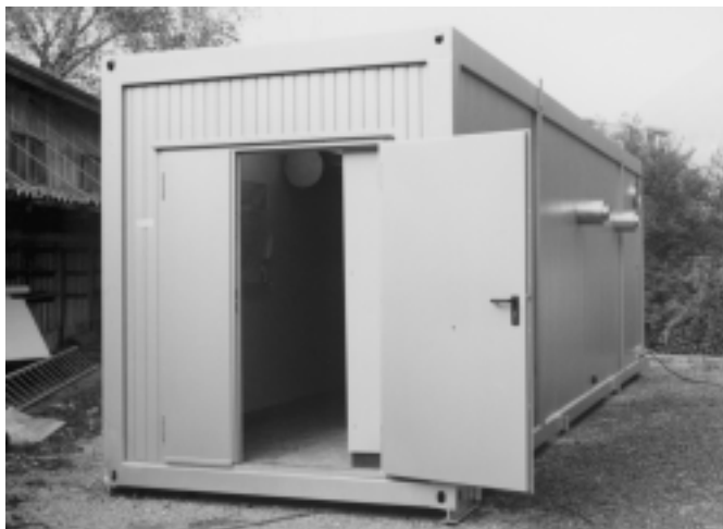
PLASMACAT in Container montiert und als komplette Anlage auf ein Dach gesetzt